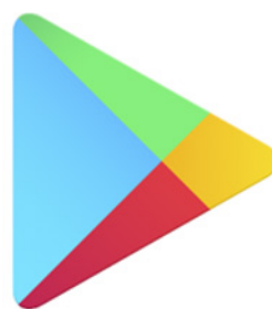
Рис.1. Іконка (символ) додатку Play Маркет

Можливо, перед цим вам знадобиться увійти у свій обліковий запис Google (гугл). Обліковий запис Google і обліковий запис Gmail (читається «джи-мейл», також кажуть гмейл або гугл-пошта) — це одне й те саме. Gmail є найбільш популярним різновидом електронної пошти. Ви можете дізнатися, як створити обліковий запис gmail, у нашому посібнику «Як налаштувати електронну адресу» .