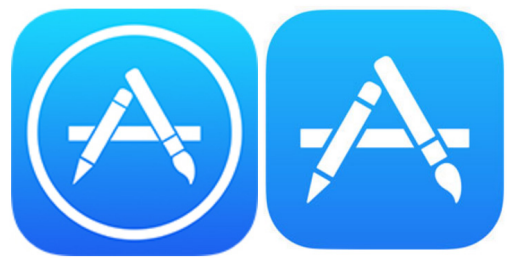
Рис. 2. App Store

Якщо у вас немає еппл айді (Apple ID), натисніть на кнопку «Створити ID» і дотримуйтеся інструкцій.